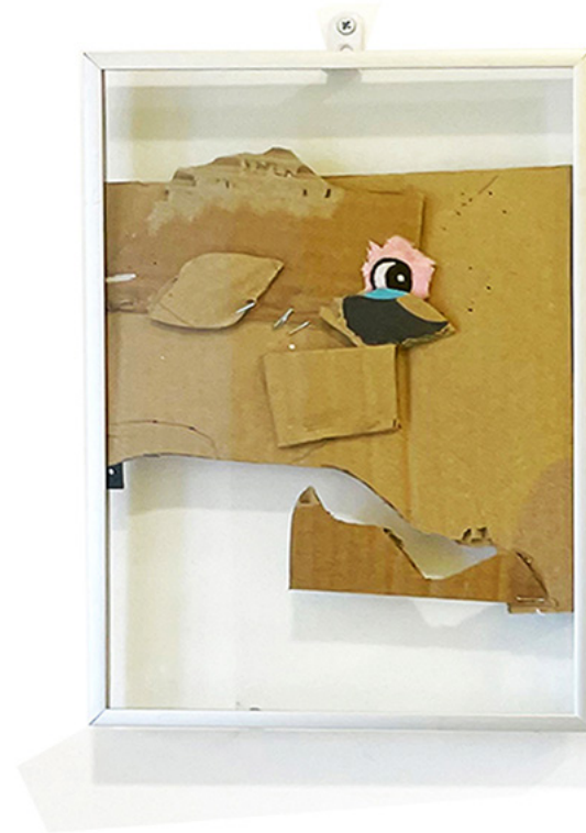
Inhame, 2023 Acrylic, pompom balls, card, plastic eyes, on wood structure 42,5x32,5cm