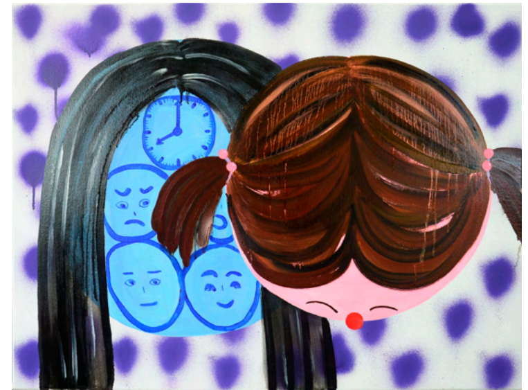
Iminente, 2024 Óleo s/ tela 112x76cm