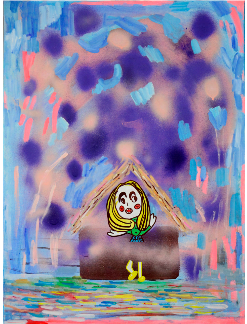
Balabala-boomboom, 2024 Acrílico e óleo s/ tela 80x60cm